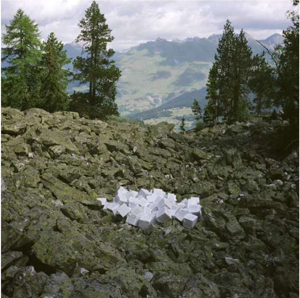
Kubinid, 2009 Copia Lambda, 85x85cm.