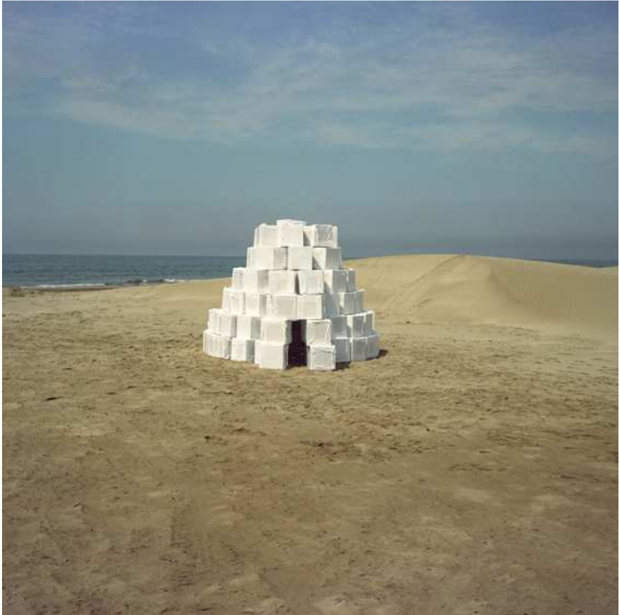
Kubigloo, 2009 Copia Lambda, 85x85cm.