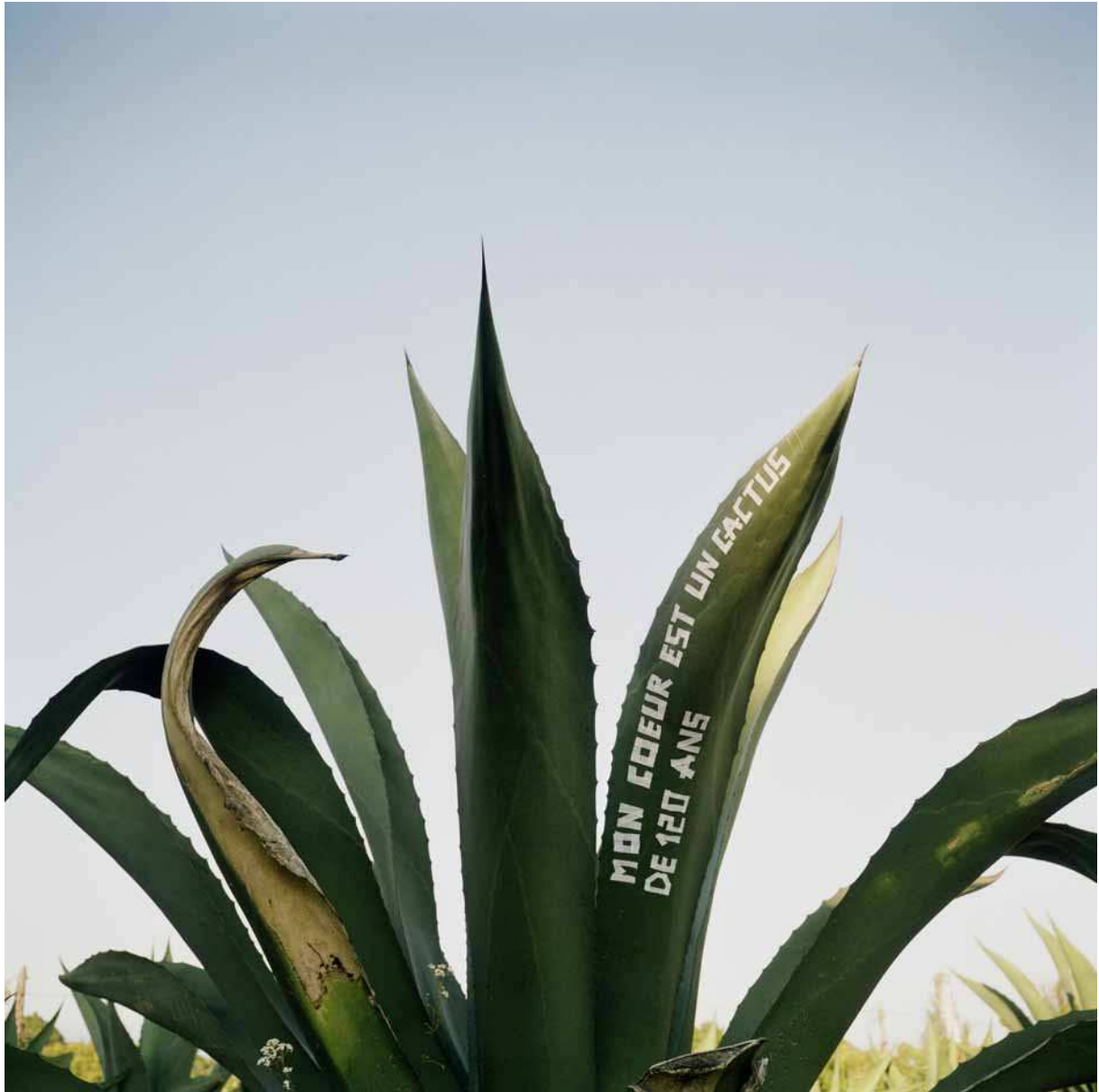
Mon coeur est un cactus de 120 ans, 2009 Copia Lambda, 70x70cm.