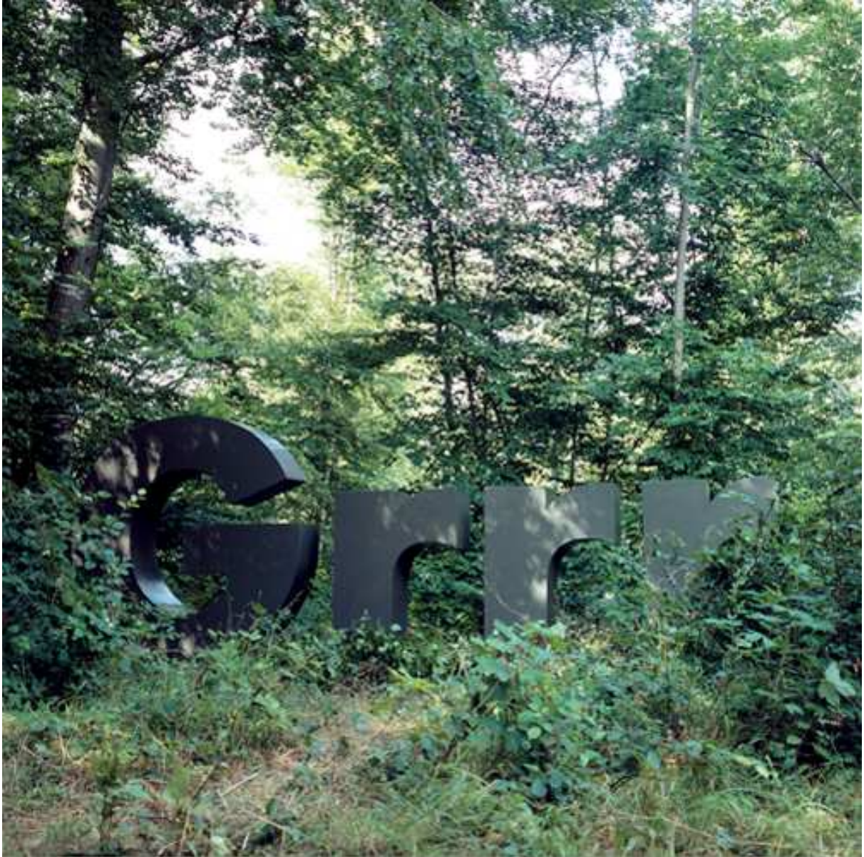
Grrr, 2007 Copia Lambda, 85x85cm.