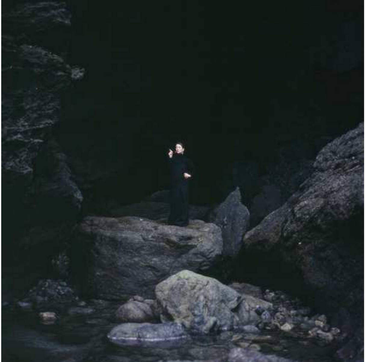
S/T, 2006 Copia Lambda, 70x70cm.