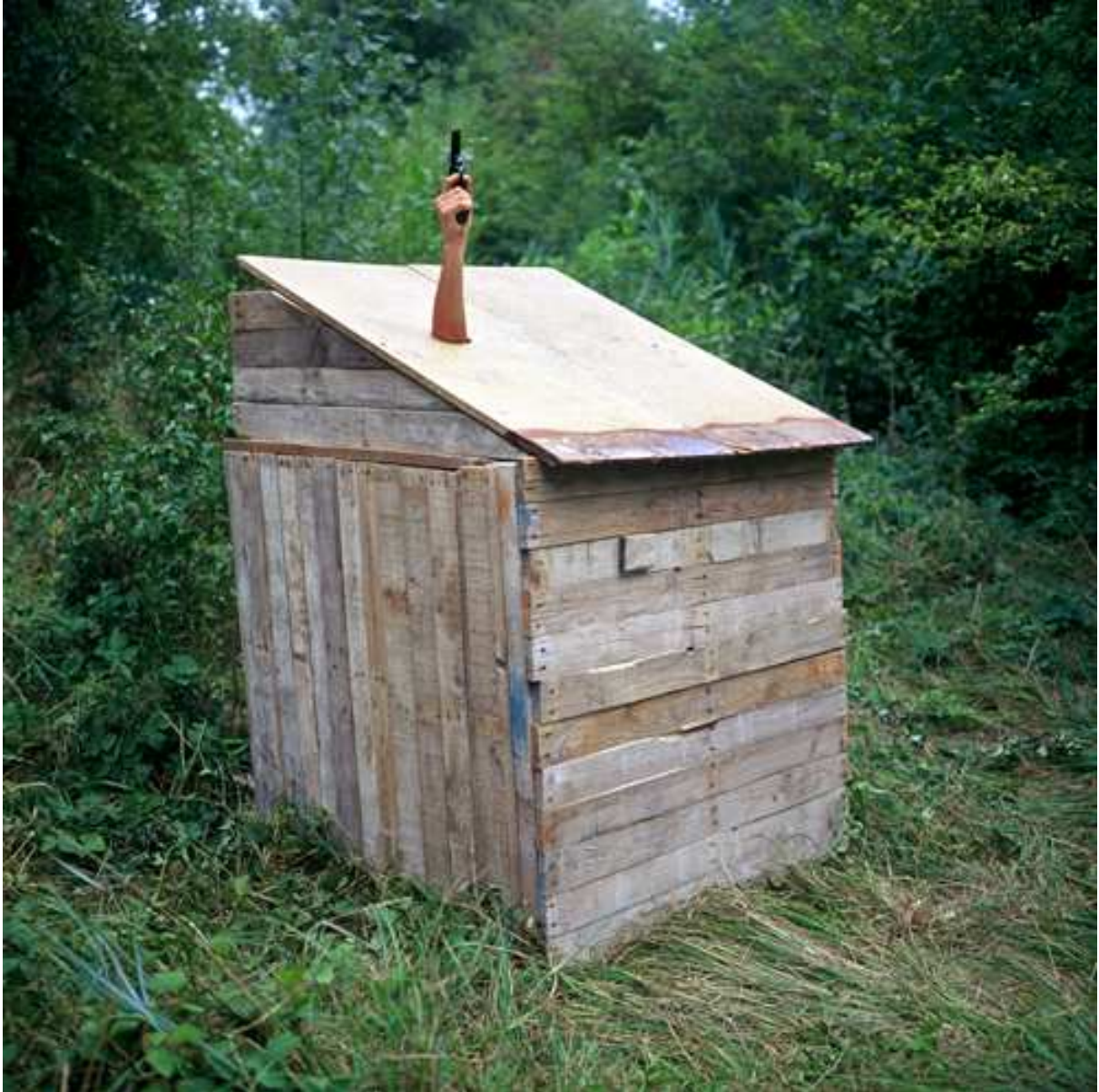
Kill Nothing, 2006 Copia Lambda, 85x85cm.