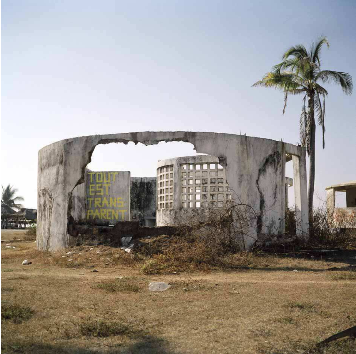
Tout est transparent, 2009 Copia Lambda, 70x70cm.