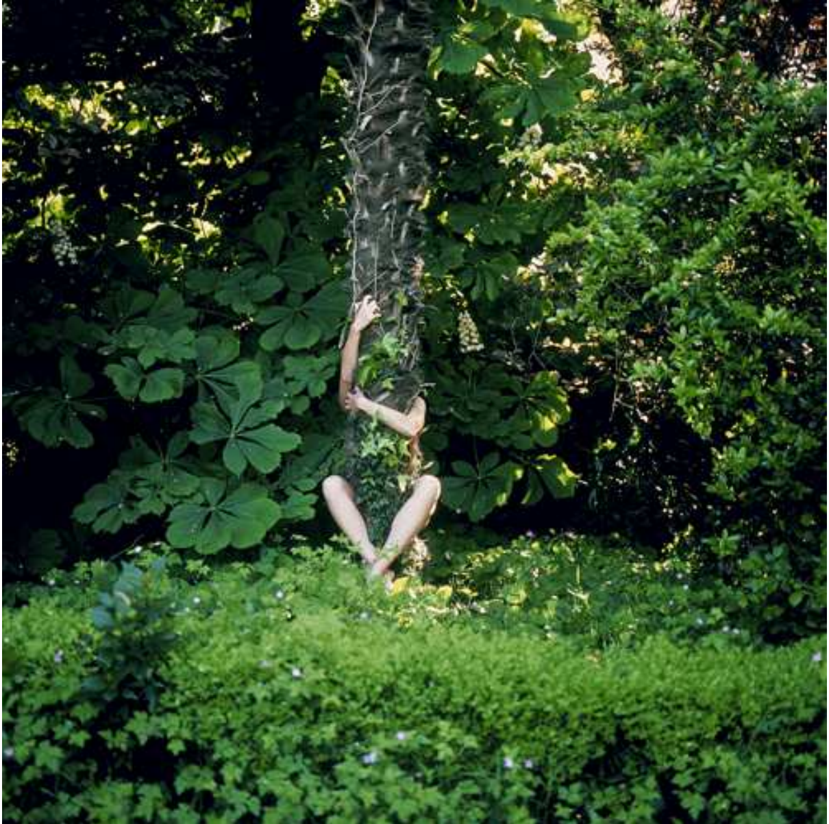
Femme Tronc, 2006 Copia Lambda, 85x85cm.