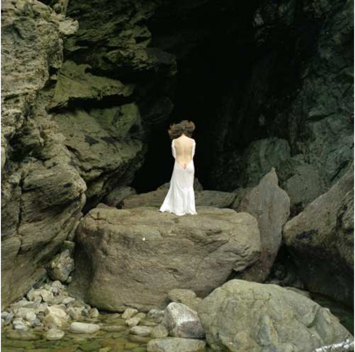
S/T, 2006 Copia Lambda, 70x70cm.