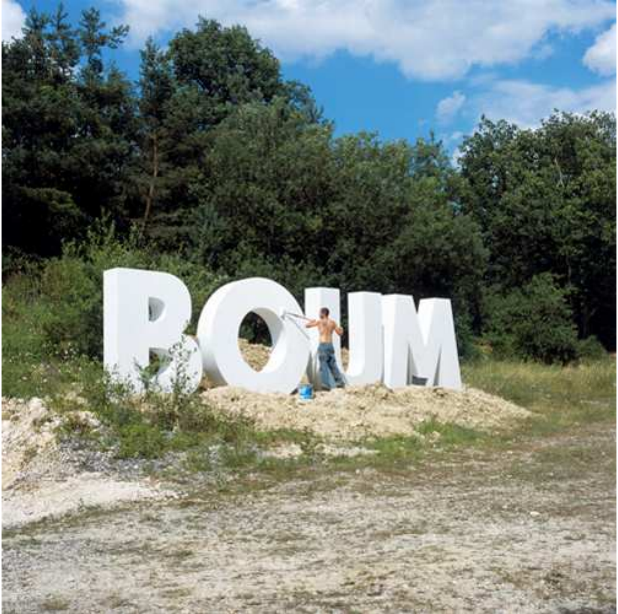
Boum, 2007 Copia Lambda, 85x85cm.